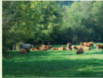
Haie et troupeau