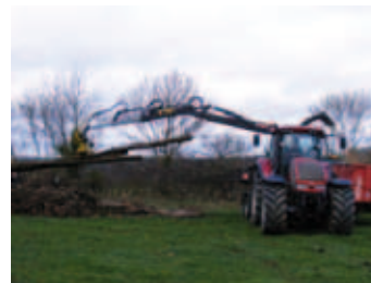
Chantier de coupe de bois