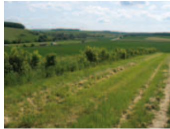
Haie brise vent implantée en 2007