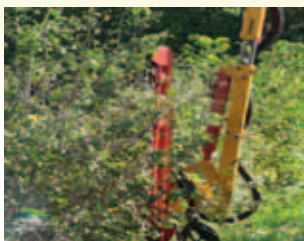
Taille-haie pour jeunes rameaux

Pour plus de renseignements, n'hésitez pas à consulter le site : www.polebocage.fr